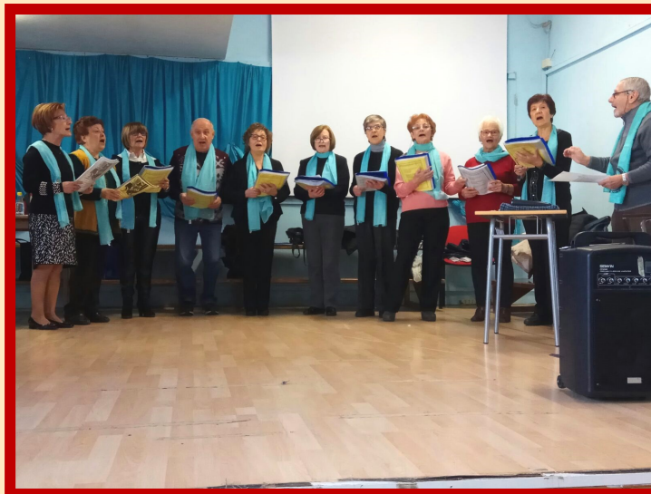
Esibizione della corale