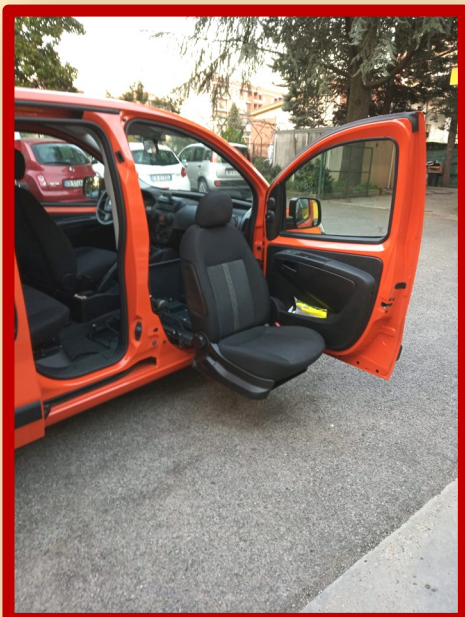
Il nuovo allestimento dell'auto sociale