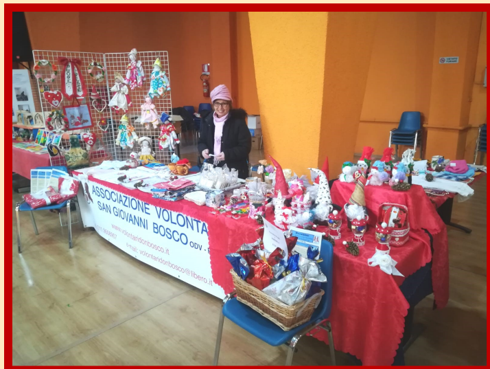
Il Gruppo ricamo al mercatino di Natale