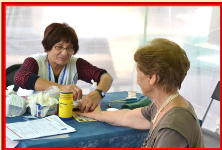
Infermieri a "Collegno in bancarella"