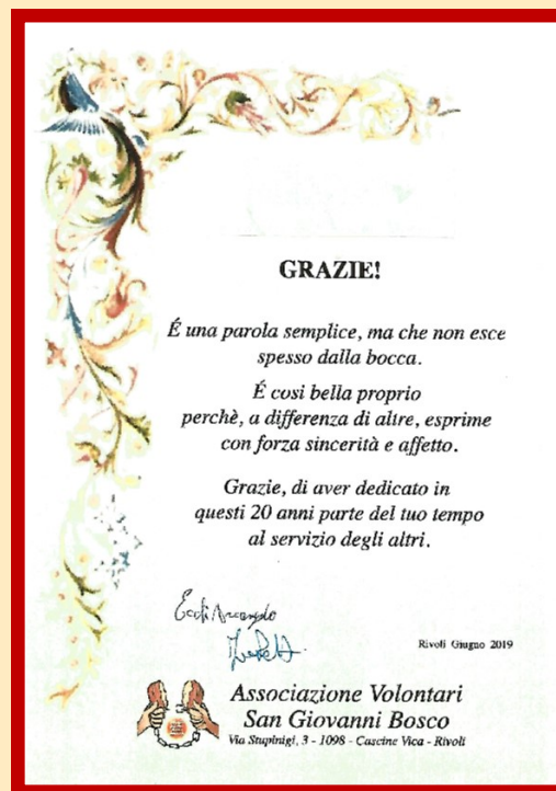
Premiazione dei 20 anni di volontariato